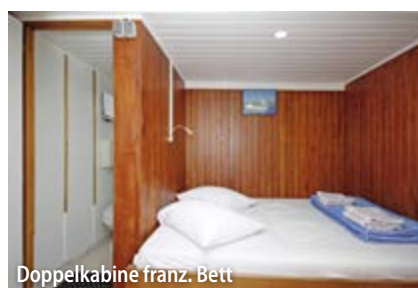
Doppelkabine franz. Bett